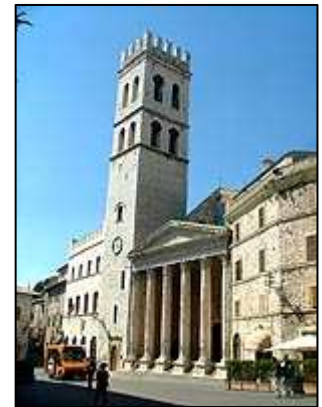
Tempio di Minerva

Od katedrály se cestou z kopce dostaneme až na náměstí Piazza del Comune , kde se mimo jiné nachází turistické informační centrum, kde zdarma obdržíte mapu města. Na náměstí stojí za shlédnutí nejen kašna, ale i Tempio di Minerva , chrám s dochovanými antickými sloupy. Na náměstí se nachází celá řada dalších paláců, za shlédnutí stojí Palazzo del Capitano.