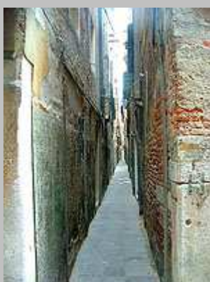
Některé uličky jsou úzké stěží na rozpažení