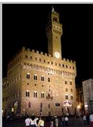
Loggia della Signora v noci