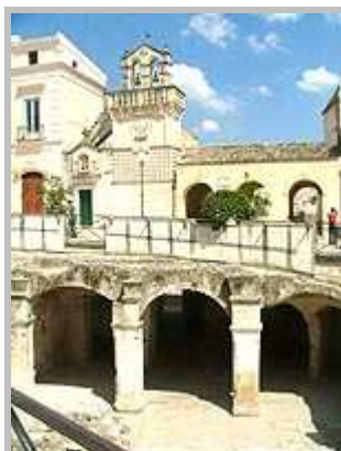
Středověké uličky města