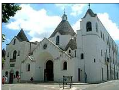
dómu na náměstí Piazza Lippolos

Městečko, které díky svým typickým obydlím trulli rozhodně stojí za návštěvu. Město leží v překrásném úrodném kraji plném vinic a dobrého vína. Historie staveb trulli , pojmenovaných podle řeckého výrazu trullos - kupole, sahá až k hrobkám mykénských vládců. Původní obydlí trulli mají jen jednu místnost a čtvercový půdorys. Jejich silné stěny se zvedají do výše 1,5 metrů a na kamenných nosnících je pak uložen vrstvený kužel střechy.