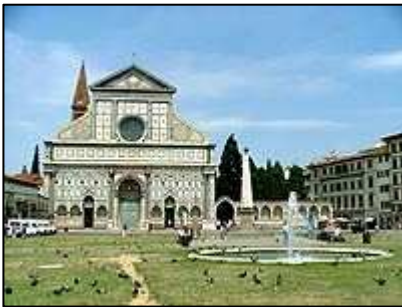
kostel Santa Maria Novella

Nádraží ve Florencii se totiž nachází v samotném centru města a zpáteční jízdenka za Prato do Florencie stála 3,20 €. Vlaky v Itálii jsou čisté a poměrně spolehlivé. Jízdenku je nutné si po koupi označit ve strojek na nástupišti. Problémem však je, že se ve vozech občas stává, že kvůli poruše nejdou otevřít některé dveře. V průběhu cesty si tak hlídejte, zda dveře, kterými hodláte vystupovat, jdou skutečně otevřít.