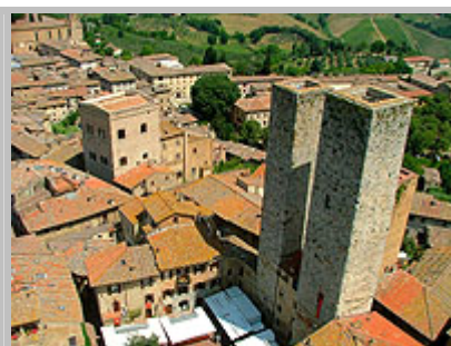
výhled z Torre della Rognosa

Naše cesta pokračovala zpět k neplacené dálnici směrem na Sienu. Sienu jsme však minuli a kousek za ní dálnice končila. My jsme však pokračovali dále po normální silnici, která vedla překrásnou krajinou plnou