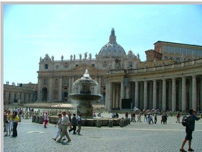
Náměstí svatého Petra - Piazza San Pietro

Posledním místem, který jsme v Římě navštívili, byla slavná a turisty doslova obložená Fontana di Trevi . Nejedná se vlastně pouze o fontánu, ale o úžasné umělecké dílo s barokním sousoším, které představuje boha moří Oceana. Dvacet metrů široká a šestadvacet metrů dlouhá fontána, kde voda jakoby přetéká přes pobřežní krajinu tvořenou skalami na širé moře je opravdu úchvatným dílem.