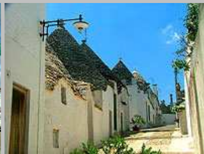
typické obydlí trulli

Dále pokračujeme směrem na Bari. Nejprve po hlavní silnici, později po neplacené dálnici. Ta vede okolo Bari, kde je poměrně hustý provoz. Ten však za městem zeslábne a my tak pokračujeme na Cerignolu, kam dorážíme po hodině jízdy. Zde najíždíme na placenou dálnici A 14. Objíždíme poloostrov Gargano a opět jedeme podél pobřeží, kde se nám otevírá překrásný výhled na moře. Asi po hodině jízdy po dálnici sjíždíme výjezdem na Vasto . Vjíždíme do města a téměř hned na kraji se nachází autokemp Il Pioppeto , kde jsme za noc zaplatili 20 €. Teplá voda ve sprše ne na žetory v ceně 0,25 €. Kemp je vybaven skromně, sociální zařízení nejsou valná, nachází se zde malý supermarket. Přímo u kempu je však písčité pláž a tak jsme se tu i vykoukali v moři.