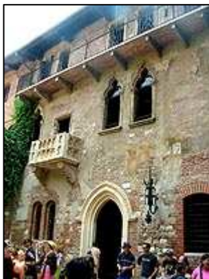
Casa di Giulietta

Naše procházka pokračovala ulicí Via Stella, která je pěší zónou z řadou občůdků. Dostáváme se na náměstí Piazza delle Erbe , kde je řada stánků se suvenýry, ale také kašna Fontana di Madonna Verona z roku 1368. Na severním okraji náměstí se nachází barokní palác Palazzo Maffei . Před palácem se tyčí vysoký sloup s benátským lvem.