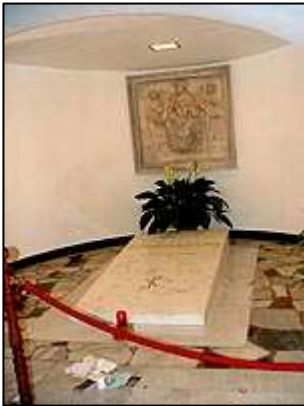
Náhrobek papeže Jana Pavla II

klimatizací, hlášením stanic přímo ve voze, videem a průchozí v celé délce. Většina vozů je však zastaralá a nedisponující žádnou z výše uvedených předností. Stanice metra v Římě nejsou tak luxusní a vzhledné jako je tomu v Praze, stanice s výjimkou moderních vozů nejsou hlášeny. Nejinak je tomu i v městských autobusech. Zatímco jsme si nejen z Prahy zvykli, že zastávky jsou hlášeny nebo zobrazovány na displeji, v Římě tomu tak není. Nutno také ještě upozornit, že všechny autobusové zastávky v Římě jsou na znamení. Pokud tedy chcete do určitého autobusu nastoupit, musíte si na něj mávnout. Když chcete na určité zastávce vystoupit, musíte stisknout tlačítko a upozornit tak na svůj požadavek. Co se římského metra týče, tak zde jezdí dvě trasy - modrá a červená, přičemž v den naší návštěvy červená trasa z neznámého důvodu po 22 hodině již nejezdila.