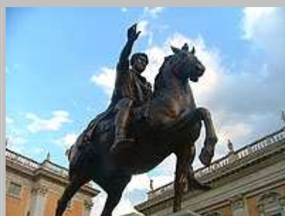
jezdecká socha Marka Aurelia