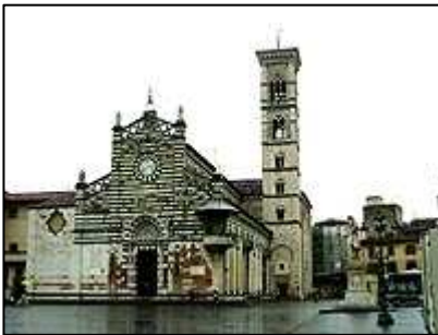
Catedrala di Santa Stefano

Toto městečko je vzdálené pouze 17 kilometrů severně od Florencie. Město je centrem textilního průmyslu, jak je však vidno podle památek, má i bohatou historii.