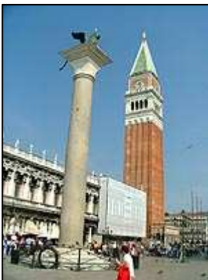
Piazzetta San Marco

Kromě vodní dopravy zde žádná jiná neexistuje a tak jsou Benátky snad jediným italským městem, kde na ulicích nepotkáte skútry ani auta. Autem je možné se do Benátek dostat z Mestre přes dálniční most pouze do blízkosti náměstí Piazzale Roma, kde se nachází velké několikapodlažní placené parkoviště. Zde je nutné auto zanechat. Dál do Benátek není možné po silnici pokračovat. Podobně je tomu, když se do Benátek vypravíte vlakem. Poblíž již výše zmiňovaného parkoviště je nádraží, ale i autobusové nádraží, kde končí všechny autobusové linky. Dále se dá jít pouze pěšky či se plavit lodí.