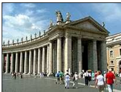
Piazza San Pietro ve Vatikánu

V autokempu Tiber Roma jsme tedy našli ubytování. Ubytování za dva lidi, stan a auto přišlo na 27 €. Kemp byl vybaven bazénem, pizzerií, obchodem, ale především tekoucí teplou vodou ve sprchách, ale i na umývání nádobí. Kemp byl prostorný, upravený s dostatkem zeleně.