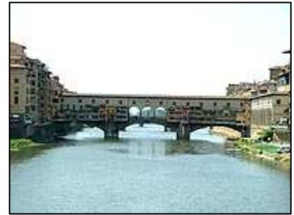
most Ponte Vecchio

Nedaleko mostu Ponte Vecchio se nachází palác Galeria degli Uffizi . V paláci se nachází největší italská galerie, která obsahuje opravdu umělecké poklady. Je zde řada obrazů od Michelangela a mnohé další skvosty. Hned v "sousedství" se nachází náměstí Piazza di Signoria, náměstí vévodí kašna zasvěcená bohu moře - Neptunovi. Dominantou náměstí je palác Loggia della Signora . Pokud se rozhodnete navštívit výtvarná a sochařská díla, nacházející se uvnitř paláce, musíte počítat s důkladnou prohlídkou zavazadel. Palác lemují sochy připomínající významné události z dějin města.