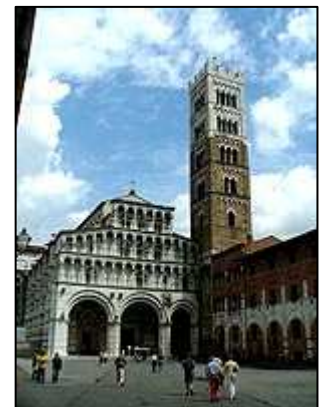
dóm sv. Martina

Odtud jsme pokračovali po pěší zóně plné turistů, která nás vedla okolo hodinové věže Torre delle Ore a několika dalších chrámů až na prostorné náměstí Piazza