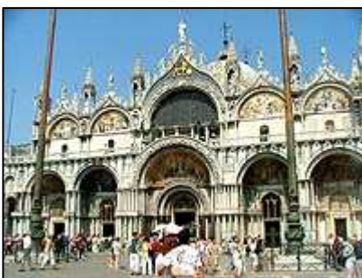
Chrám sv. Marka

Kolem kostela Chiesa di Tolentini jsme dorazili snad do jediného parku ve městě, kde jsme si ve stínu v klidu odpočinuli. Park Giardini Papadopoli se nachází nedaleko Piazzale Roma a současně tak i vlakového nádraží. Po odpočinku a chvíli sledování toho cvrkotu na přestupní stanici z pozemní dopravy na vodní, jsme se vydali dále a to sice směrem k nedalekému benátskému přístavu. Podél pobřeží jsme šli směrem na Punta della Dogana, kde se nachází kostel Chiesa di Santa Maria della Salute . Ze schodů před kostelem je krásný výhled na náměstí sv. Marka.