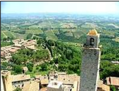
výhled z Torre della Rognosa

Naše kroky pak pokračovaly dále ulicí Via San Matteo, kde je velké množství obchůdků s nejrůznějšími suvenýry. Došli jsme až k městské bráně na severním okraji města, odtud jsme se vrátili nazpět. Pokud při cestě nazpět těsně po průchodu náměstím Piazza della Cisterna odbočíme vpravo, dostaneme se po chvíli k muzeu vína, ale také tím získáme možnost prohlédnout si město z hradeb.