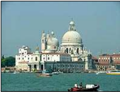
Katedrála di San Giorgio Maggiore

Benátky jsou zcela jedinečným městem. Na 118 ostrůvcích spojených 400 mosty se rozkládají stavby. Ostrovy odděluje 115 kanálů, na kterých panuje čilý dopravní ruch gondol, výletních lodí, ale i mnohých motorových člunů.