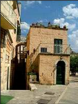
Středověké uličky města

Matera evokuje chudou rolnickou kulturu, která od prehistorických dob začala hloubit zdejší proslulá skalní obydlí. Tato skalní obydlí jsou tak úchvatná, že město je na seznamu památek světového kulturního dědictví UNESCO. Ještě dlouho po druhé světové válce prý lidé v těchto jeskynních domech žili a to mnohdy v jedné místnosti i se zvířectvem. Zdejší pověstné sassi - obydlí z tufového kamene, napůl postavené, napůl vytesané ve skále, byly domovem obyvatel Matery ještě do 50. let 20. století.