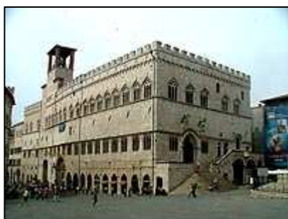
Palazzo dei Priori

Hlavní město Umbrie se 150 tisíci obyvateli se rozkládá na kopci nad Valle Umbra a v okolních údolích. Město má bohaté umělecké a kulturní tradice. Město je také domovem nejznámějšího druhu baci, což je báječná čokoláda s lískovými oříšky.