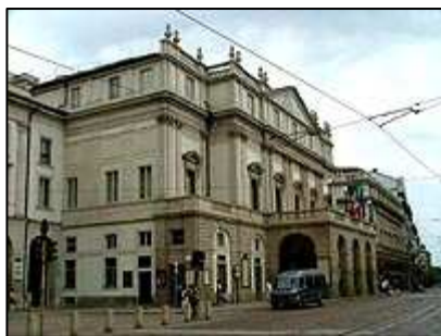
divadlo La Scala

na náměstí Piazza P.Marino. Pokud však hledáte velkou a výstavnou budovu, budete zcela jistě zklamáni. Divadlo pochází z roku 1778, prý pojme až 3000 návštěvníků, ale zvenčí to rozhodně není žádná výstavná budova.