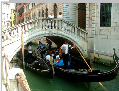
Gondoly - typický to znak Benátek