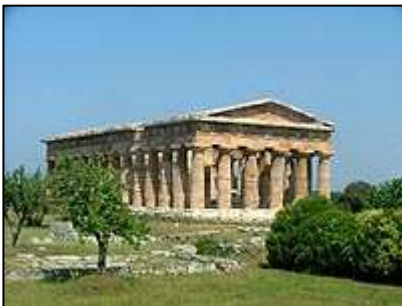
Jeden z dochovaných chrámů

Na rozdíl od Pompejí, je krása Paestumu patrná již před vstupem do areálu. Tři obdivuhodně zachovalé dórské chrámy jsou zdaleka viditelné a již zdaleka lákají ke své návštěvě. Vstup do areálu stojí 4 €, pokud se odhodláte navštívit také archeologické muzeum, zaplatíte 6 €.