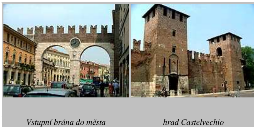
Vstupní brána do města