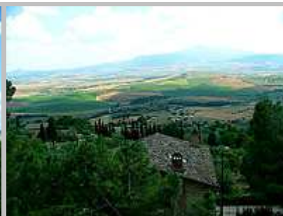
Výhled do krajiny Toskánska

Z Pienzy jsme se vraceli zpět do Sieny, kterou jsme před několika hodinami pouze mĳjeli. Toto město je ze všech dnes navštívených největší, proto zde již je určitý problém s parkováním.