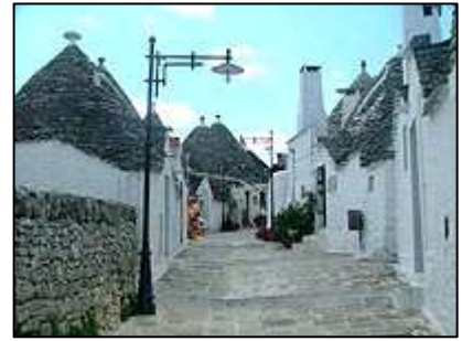
typické obydlí trulli

Projít městečko trulli netrvá dlouho, velmi pohodlně se návštěva dá stihnout za jedinou hodinu. Během té doby se můžeme toulat uličkami lemovanými domky se špičatou střechou a v některých z nich se seznámit například s tím, jak takové stavby vznikají nebo ochutnat některé z nepřeborného množství likérů a vín zde nabízených. Postupně tak můžeme dojít až k dómu na náměstí Piazza Lippolos .