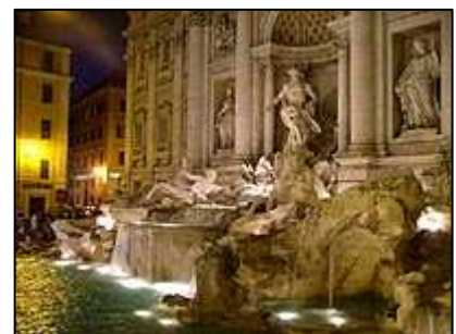
Fontana di Trevi