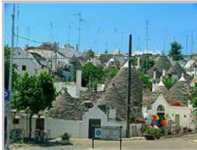
typické obydlí trulli