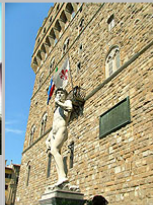
Michelangelova socha Davida