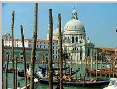
Katedrála di San Giorgio Maggiore