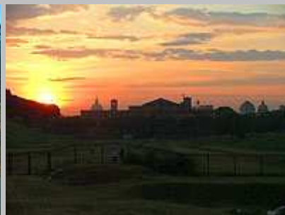
Západ slunce nad Římem

Tím naše návštěva Říma skončila. Problémy však nastaly při cestě zpět do kempu. Jelikož po 22 hodině již nejezdila jedna trasa metra, trvala nám cesta několika autobusovými linkami cesta zpět hodinu a půl.