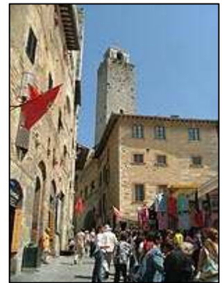
Piazza della Cisterna

Nejprve jsme dorazili na náměstí Piazza della Cisterna , které je pojmenované po vodní nádrži, která zde kdysi stávala. Na přilehlém náměstí Piazza Duomo , jak již název napovídá, stojí katedrála a proti ní Palazzo del Podesta s věží Torre della Rognosa . V tomto paláci naleznete výstavu, ale i možnost vystoupat nahoru na věž, odkud je opravdu překrásný výhled nejen na celé středověké město, ale i na překrásné okolí toskánské zvlněné krajiny s množstvím přírody, pastvin, polí a lesů. Vystoupat na věž a prohlédnout si okolí z ptáčích perspektiv stojí opravdu za to a to i za cenu 6 €, které je nutno zaplatit. Vedle paláce se nachází turistické informační centrum, kde je možné zdarma získat mapu města.