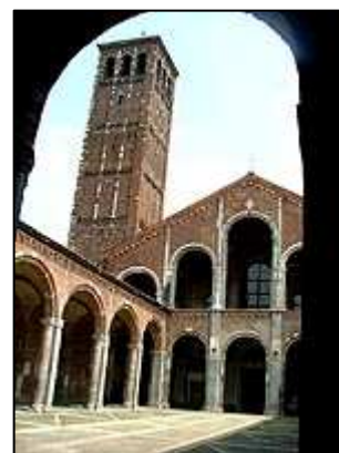
chrám sv. Ambrože

Přes náměstí Piazza Cadorna, kde můžeme obdivovat prazvláštní moderní skulptury a fontánu, se ocitáme před milánským zámeckým komplexem Castello Sforzesco . Stavba zámku započala roku 1450 a měl být rezidencí tehdy vládnoucího rodu Sforzů. Cihlový čtyřúhelníkový komplex budov je 250 metrů dlouhý a stojí za shlédnutí. Vnitřní expozice jsme sice neshlédli, ale zajímavá je již prohlídka nádvoří Piazza d'Armi, na kterém se dříve konaly turnaje, či náměstí Corte Ducale. V okolí zámku se nachází rozsáhlý zámecký park, kde je dostatek stínu, laviček i vodních ploch pro odpočinek po celodenní procházce městem. Na opačném konci parku se nachází mírový oblouk Arco della Pace, v parku nalezneme i například mořské akvárium či výstavní palác. Zámecký komplex jsme opustili hlavní branou a ocitli jsme se před velkou fontánou. Ulicí Via Dante se dostaneme opět na Piazza Duomo, kde se nachází také například restaurace Mc Donald, kde je možné zdarma použít v případě potřeby WC. Na náměstí jsme pak nasedli na metro a vrátili se nazpět k autu.