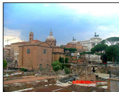
bazilika sv. Petra

Jednorázová šedesátiminutová jízdenka je za 1 €, celodenní pak za 4 €. Automat přijímá kromě mincí i bankovky a peníze dokonce vrací. Při prvním nástupu do vlaku či jakéhokoliv jiného prostředku římské hromadné dopravy je nutné jízdenku označit v jízdenkovém automatu uvnitř vozu či u vchodu do metra. Není bez zajímavosti, že při vstupu do metra je nutné projít okolo dozorcího stanice a jízdenku předložit. Vstup do metra je totiž jinak přes turnikety, kde je nutné označit jízdenku po jednotlivou jízdu.