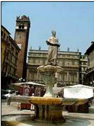
Fontana di Madonna Verona

Verona je druhým nejvýznamnějším městem Benátska. Leží na úpatí horské skupiny Monte Lessini při řece Adiči.