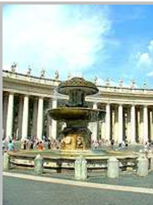
Kašna na náměstí sva. Petra ve Vatikánu