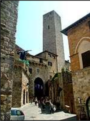
uličky středověkého města

Městečko, které leží 38 kilometrů severně od Sienu je nápadné již z dálky svými vysokými věžemi a připomíná tak americký Manhattan.