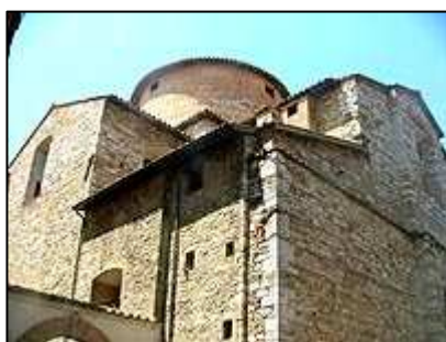
Torre degli Sciri

Právě z náměstí Piazza Italia vede pěší zóna Corso Vannucci. Tou jsme prošli přes náměstí Piazza della Republica , kterou lemuje řada restaurací. Na konci pěší zóny se nachází náměstí Piazza IV. Novembre . Na tomto náměstí naleznete turistické informační centrum, kde je zdarma k dispozici mapa města.