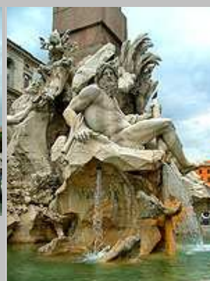
Fontana dei Fiumi na náměstí Piazza Navona