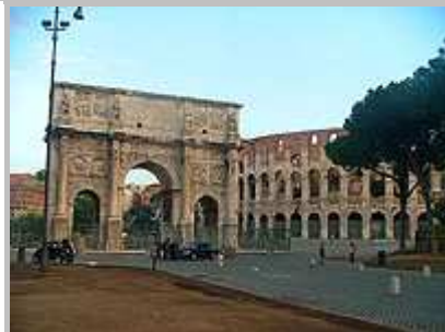
Koloseum a Vítězný oblouk