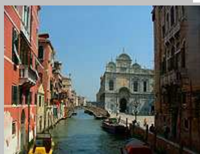
romantika města na vodě