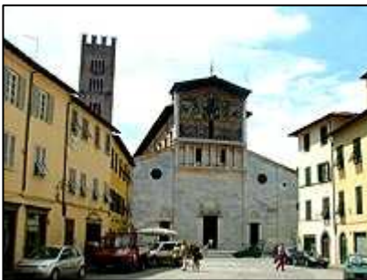
chrámu San Frediano

Naše kroky dále vedly křivolakými uličkami k další zajímavé stavbě, kterou je věž zvaná Torre Guinigi . Z vrcholu věže je zajímavý výhled na město. Věž je zajímavá také tím, že na jejím vrcholu rostou stromy jako v nějaké zahradě.