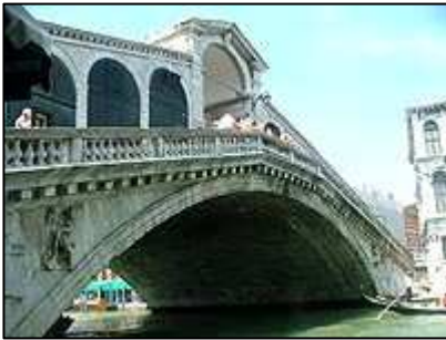
Ponte di Rialto

Naše další cesta pokrčovala do baru na snídani. Mohu vřele doporučit ochutnat v Itálii kromě pizzy či špaget také některou z typických italských káv, jako například kafe late a k tomu například brjóž, který u nás nazve pod názvem croasan, ale v dopoledních hodinách je v italských barech k dostání s daleko lepší chutí, čerstvě upečené a teplé plněné například marmeládou. Nutno však dodat, že tuto pochoutku lze například v Perugii koupit za necelé euro, v Benátkách za dvojnásobnou cenu.