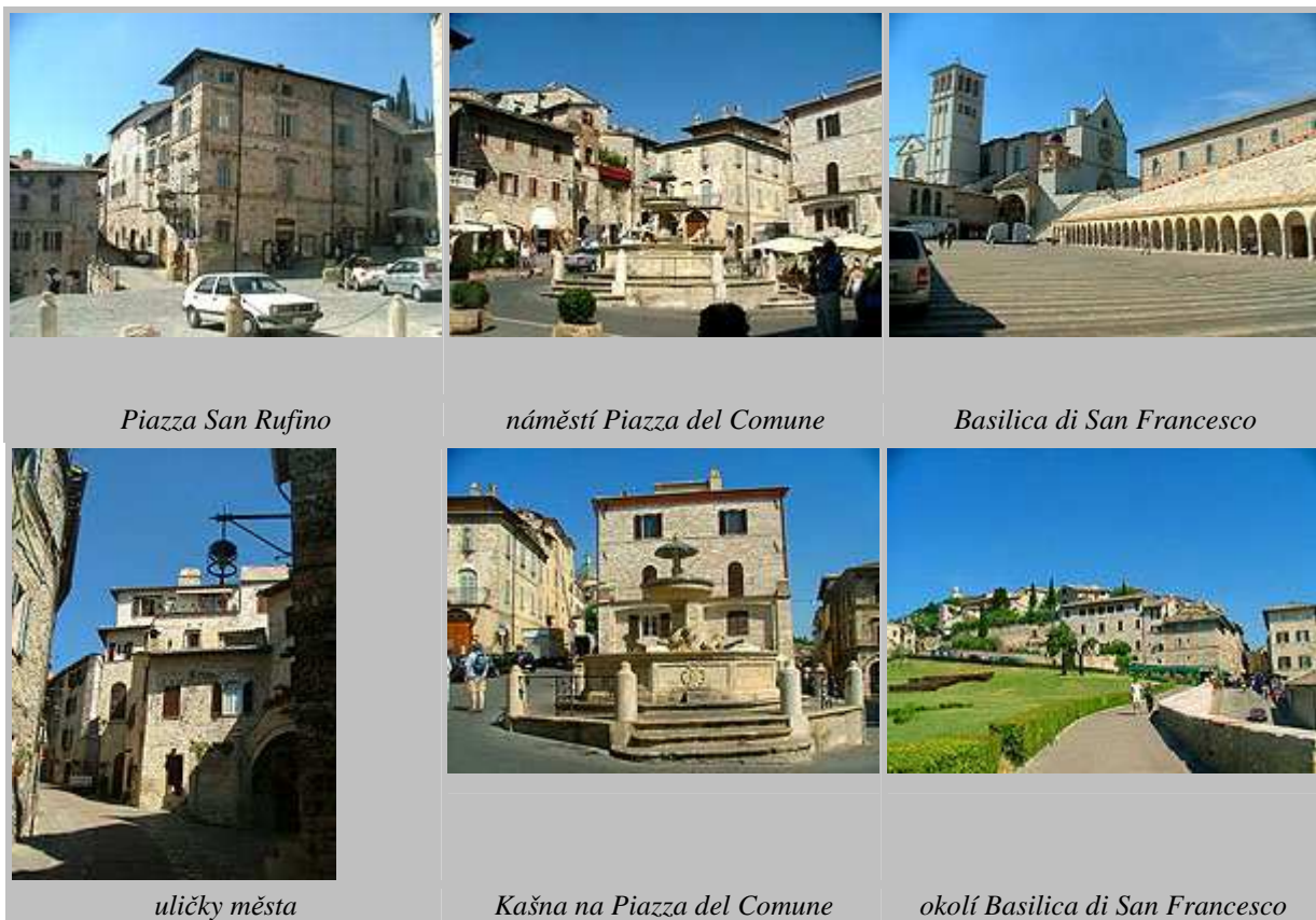
Piazza San Rufino