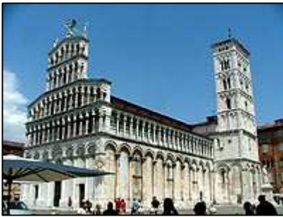
kostel San Michel in Foro

Zaparkovali jsme na velkém parkovišti u okruhu okolo hradeb. Parkování po dobu dvou hodin je zde zdarma, delší parkovací doba je placená.