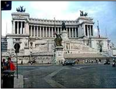
Památník Viktora Emanuela II

Přes most Ponte Sant'Angelo jsme se ulicí Via dei Coronari dostali na náměstí Piazza Navona . Toto náměstí je neustále plné turistů. Ale nejen turisté zaplňují prostory tohoto náměstí. Především se zde nachází množství malířů, karikaturistů a dalších pouličních umělců. Turisté zde