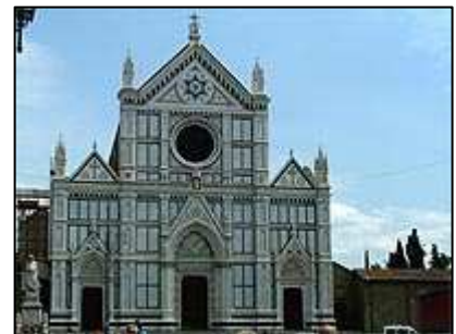
chrám di S.Groce

Naše kroky dále vedly přímo na Piazza Duomo, kde se nachází snad nejobdivuhodnější památka Florencie. Je jí gotická katedrála Santa Maria del Fiore , která je čtvrtým největším kostelem v Evropě a je jakýmsi symbolem Florencie. Jeho oranžová kopule dosahuje výšky 106 metrů. Další významnou památkou, která se nachází hned v sousedství chrámu je románské babtisterium, které bylo postaveno v 11. a 12. století z bílého a zeleného mramoru. Uvnitř je možné spatřit mozaiky Posledního soudu z 13. století. Největší chloubou babtisteria jsou však jeho dveře.