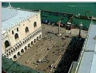
Dóžecí palác z ptačí perspektivy