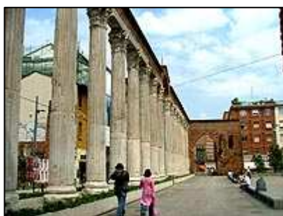
římské sloupy před San Lorenzo Maggiore