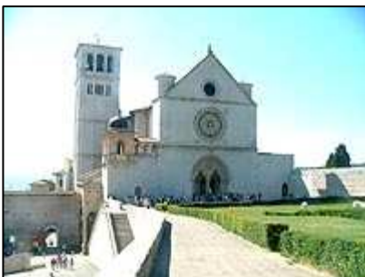
Basilica di San Francesco

Několika cestami je možné se z náměstí dostat k hlavní památce, kam směřují snad všichni návštěvníci města. Touto vyhledávanou památkou je Basilica di San Francesco . Nejedná se však o jeden kostel, ale hned dva. Nevím, zda se tato rarita nachází ještě někde jinde na světě, ale je vskutku impozantní navštívit dva zcela odlišné chrámy ve dvou patrech nad sebou a ještě kryptu o patro níže. A proč dva kostely? Dolní kostel slouží jako pohřebiště a poutní kostel, v horním kostele se slouží mše a bohoslužby pro občany Assisi. Pod klenbami dolního kostela si budete připadat jako pod noční oblohou, horní kostel je naopak naplněn světlem. V již zmiňované kryptě jsou pak zpřístupněny o patro níže