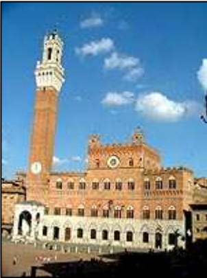
Palazzo Pubblico a Torre del Mangia

Toto šedesáti tisícové město patří bezesporu mezi nejkouzelnější italská města. Středověké centrum je plné majestátních gotických staveb. Město se rozvoje dočkalo ve 12. až 15. století. Mezi Sienou a Florencií panovala po staletí velká řevnivost a rivalita, která vyvrcholila v letech 1555 až 1559, kdy Siena definitivně podlehla a stala se součástí Toskánska, kde je centrem Florencie.