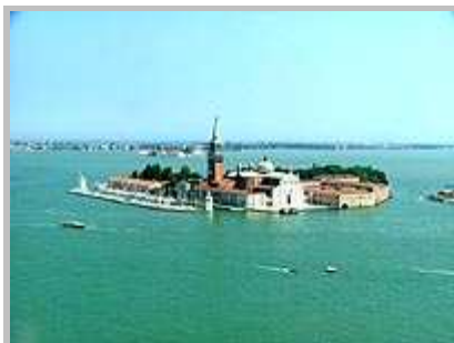
Pohled na ostrovy z ptačí perspektivy

Tím naše návštěva Benátek končí. Nasedáme na loď a odjíždíme zpět do Punta Sabbioni.