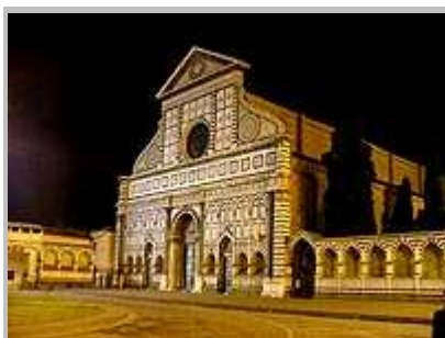
kostel Santa Maria Novella v noci

Po výborné večeři jsme se vydali na večerní procházku Florencie . Krásně nasvícené památky opravdu stojí za shlédnutí.