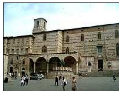
Cattedrale di San Lorenzo

města a dopravní značky vás navedou přímo na parkoviště. Cena za parkování se pohybuje okolo 1 € za hodinu. Přímo v samotném centru je parkovacích míst minimum. Důvodem je také skutečnost, že centrum města se nachází na kopci. A doprava do centra města je zde zcela nezvyklá. Přímo z podzemního parkoviště se do historického centra města dostanete sérií eskalátorů, které do centra města vedou hned ze tří směrů. My jsme auto zaparkovali v podzemním parkovišti na náměstí Piazza Partigiani. Odtud vede nejdelší série eskalátorů, která nás dovezla až na náměstí Piazza Italia .