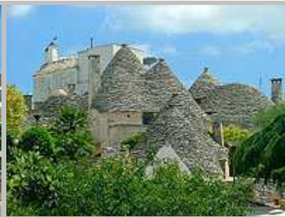
typické obydlí trulli