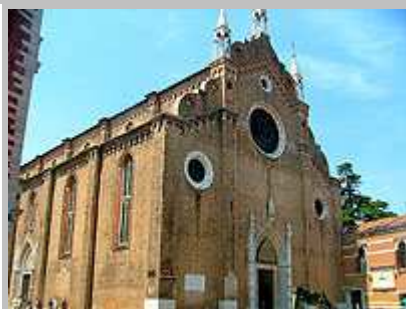
kostel Santa Maria Formosa