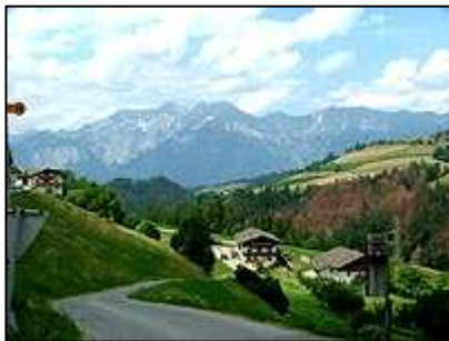
Alpská scenérie v Rakousku

Vzhledem k tomu, že naše cesta mířila k jezeru Lago di Garda a vzhledem k tomu, že jsme chtěli ušetřit na poplatcích za rakouské dálnice, rozhodli jsme se pro trochu dobrodružnější cestu přes Alpy. Z Rozvadova jsme zamířili směrem na Koblitz a dále pak po německé dálnici číslo 93 směrem na Regensburg, v místě zvaném Dreieck Hollendau jsme se napojili na dálnici číslo 9 do Mnichova. Mnichov bohužel nemá dálniční okruh kolem města tak, abychom se mu vyhnuli. Nicméně značení směrem na Garmisch Partenkirchen po dálnici číslo 95 je zde dobré, takže stačí sledovat dopravní značky a ty vás navedou na vnitřní městský okruh.