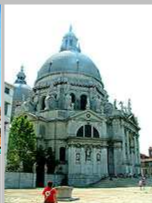
Katedrála di San Giorgio Maggiore