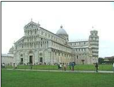
Piazza dei Miracoli

Do Pisy jsme přijeli ze severní strany a hned na kraji města se po levé straně nachází obchodní centrum, kde je i velké parkoviště, kde je možné bezplatně zaparkovat. Odtud to je do centra města, kde se nacházejí ty nejvýznamnější památky, asi 10 minut chůze.