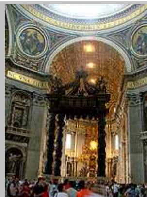
Interiér chrámu sv. Petra