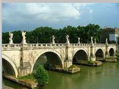
most Ponte Sant'Angelo