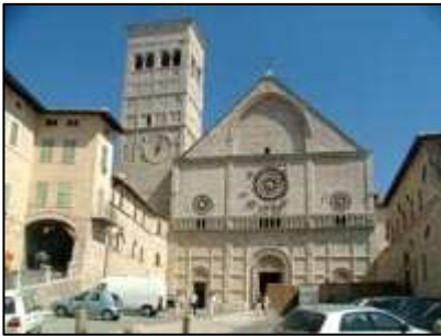
Katedrála San Rufino

Město je nejvýznamnějším italským poutním místem, které si stále zachovává svou přirozenou krásu. Ve městě, které je obklopeno horami, žije na 25 tisíc obyvatel. Roku 1182 se ve městě narodil svatý František a jeho duch je zde dodnes patrný.