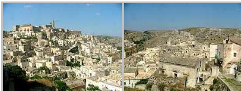
město je vystavěno na skále