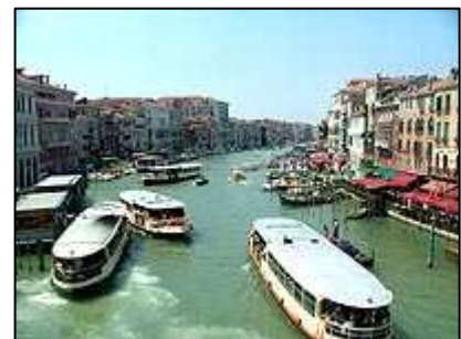
běžný provoz na kanále

Poté jsme již zamířili ke slavnému mostu Ponte di Rialto , který byl jako první kamenný v Benátkách postaven roku 1592. Most je vyzdoben množstvím obchůdků s nejrůznějšími suvenýry. Most však zároveň poskytuje úchvatný pohled na Velký kanál . Rozhodně stojí za to sledovat živý lodní provoz na kanálu, kde se vedle tzv. autobusů prohánějí motorové čluny policie či například čluny ambulance s modrým majákem. Při troše štěstí je možné spatřit i popelářské čluny či čluny vozící stavební materiál. Po opačném břehu mostu jsme se vydali po nábřeží, kde se nachází řada restaurací.