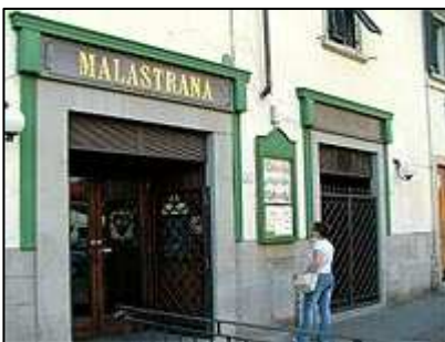
restaurace Malá Strana

Na nedalekém náměstí Piazza Francesco d'Assisi se nachází další velmi zajímavý kostel, který stojí za návštěvu. Popravdě řečeno, my jsme se do tohoto kostela schovali před silným deštěm, který se nad Prátem zrovna strhnul.