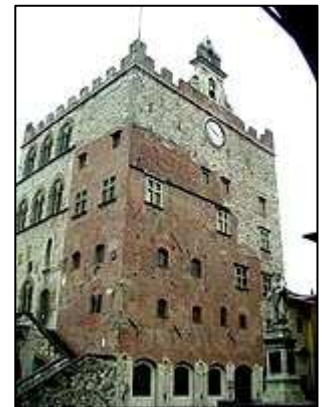
palác Palazzo Pretori

Po chvíli jsme se ocitli na náměstí Piazza del Comune, kde se náhle ocitneme před palácem Palazzo Pretori . Dvě zajímavé památky se pak nacházejí na náměstí Piazza Santa Maria delle Carceri. Jedná se o chrám Santa Maria delle Carceri, který pochází z 15. století a dále pak Castello dell'Imperatore, který dal ve 13. století postavit římskoněmecký císař Fridrich II.