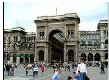
galerie Viktora Emanuela

Přímo na náměstí Piazza Duomo se nachází městské informační centrum, kde je možno si zdarma vyzvednout turistickou mapu města. Nejvýznamnější památkou je zcela určitě dóm. Je největší gotickou stavbou v Itálii, na délku měří 157 metrů, takže pouze samotné obejití chrámu zabere určitý čas. Nejvyšší věž dosahuje výšky 108,5 metrů. Stavba chrámu započala roku 1386, unikátní stavba byla dokončena až roku 1887. Zajímavé však je, že za celou dobu pěti set let, kdy chrám vznikal, nedošlo k odchýlení od původního gotického stylu. Dóm se pyšní 135 věžičkami, na té nejvyšší ne nachází socha Madony, která je symbolem města.