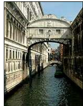
Ponte dei Sospiri

Benátkách. Pokud se nechcete přepravovat pěšky, máte ještě jednu možnost - projet se jednou z mnohých gondol. Benátská doprava je jednou z největších zvláštností tohoto města.