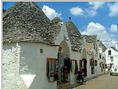
typické obydlí trulli